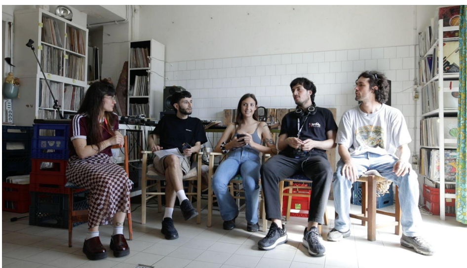
Figura 1. La troupe sul set del focus group presso la Pescheria Alessi, sede del collettivo Tropicantesimo

Il documentario “Roma Est di notte” è il risultato del montaggio realizzato a partire dalle interviste e dal focus group. L’obiettivo esplorativo del progetto ha guidato il montaggio del girato, organizzato dalla ricorrenza delle parole dense nel discorso degli intervistati. In altri termini, il montaggio ha sostenuto l’interpretazione della cultura locale esplorata. La scelta delle parole dense è stata guidata dal vincolo dell’obiettivo del documentario: far emergere le culture che informano tali contesti aggregativi. Abbiamo infine selezionato e dato risalto alle clip che ricostruivano la nascita della scena e il suo contesto territoriale e sociale.