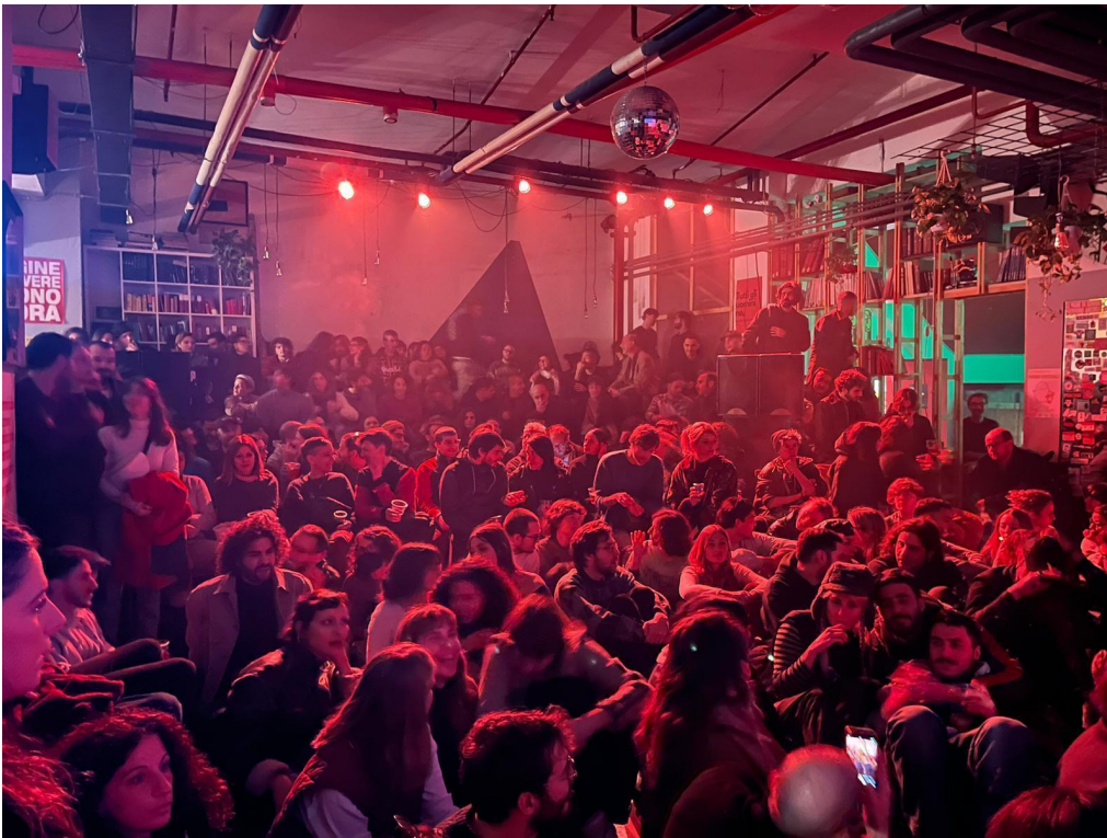
Figura 2. Il primo incontro di restituzione presso la sede romana di Scomodo